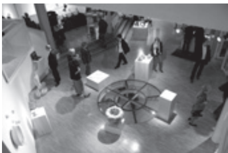
カプフェンベルク国際陶磁ビエンナーレ会場 International Biennale of Ceramics 2009 in Kapfenberg, Austria