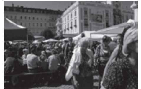
グムンデン陶器祭り

held every year in the last week of August. Although it is only three days, many outdoor booths are set up and ceramic artists gather from all over Europe. The city's museums and galleries invite a variety of ceramic artists to hold exhibitions. In addition to everyday pottery, the festival provides an opportunity to see avant-garde work and sculptural ceramics. My exhibition was sponsored by the city of Gumunden and held in the Salzfertigerhaus, one of the city's oldest buildings that is designated as a cultural asset. I visited the gallery before my exhibition and measured its dimensions. Since it is an old building, I wanted to create work using part of the space, work that would not be possible in a modern white cubic gallery. On the last day of my exhibition, several people told me that my work was attracting attention and that other artists had told them to come and see my exhibition. I was relieved that my exhibition was a success. Many artists greeted me as I passed them on the street, and I was introduced to a number of other artists. It was very satisfying for me