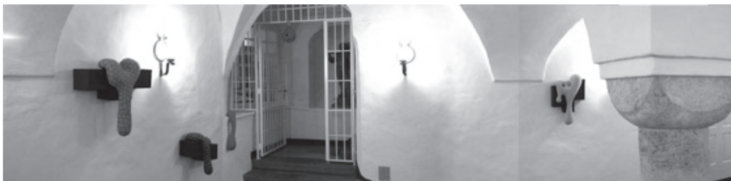
ザルツフェルティガーハウス展覧会の様子

また、オーストリアではカプフェンベルクという町で国際陶磁ビエンナーレが開催されており、私もそれに入選し、参加することが出来た。このビエンナーレでは毎回違うテーマが定められていて、作家は自分の作品がそのテーマに合っているかを応募する際に書かなければならない。今回のテーマは“at the moment”で、どのようにそのテーマを突き詰め、表現しているかも受賞する上では重要だ。いかにコンセプトが重要視されているかが審査方法からも伺える。受賞・入選作品はカプフェンベルクで展示された後、ドイツのヴェスターヴァルト陶芸美術館で2010年夏に再び展示されることになっている。